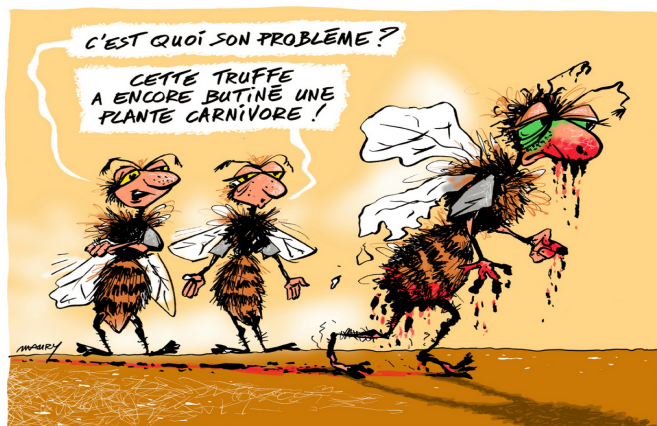
Illustration Serge Maury