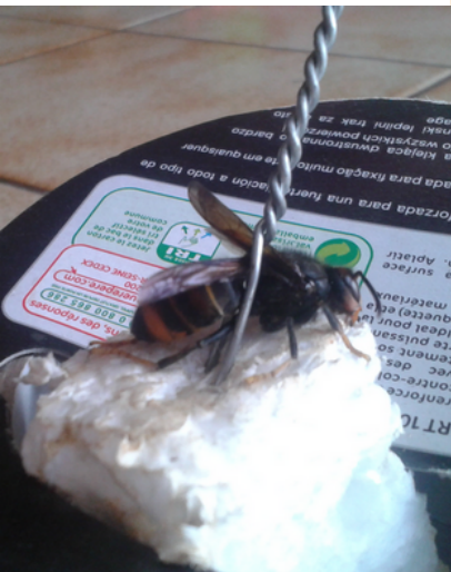
Le frelon asiatique maintenu sur un polystyrène avec une fourchette maison !

Raymond PETIT (apiculteur à Douy). Réagissez sur le Forum.